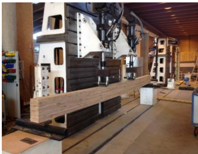
Photo 2 : Test de résistance mécanique sur une poutre BLC de chêne