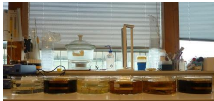
Photo 1 : Mise au point de la méthode de migration des tannins : pré-test d'immersion de chêne revêtu de diverses peintures

Pour les taches visibles sur du bois brut, l'acide oxalique et l'oxone® semblent être les solutions de nettoyage les plus efficaces.