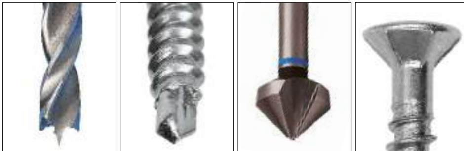
Sans pré-perçage grâce à la pointe auto-perceuse.