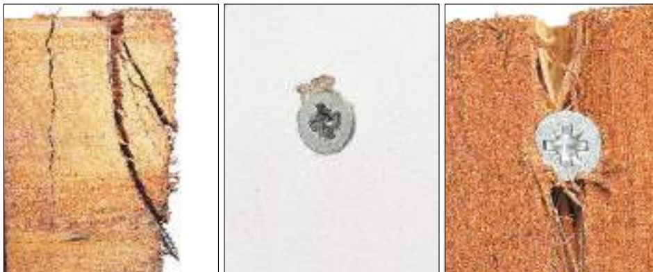
Empêchent le vissage en biais lors de l'enfoncement des vis de grandes longueurs.