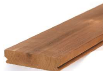
Figure 1: Cœur en face visible

Nos produits en pin sont utilisés du côté du cœur en raison de sa meilleure durabilité (Figure 1). Les propriétés du bois de cœur du pin réduisent le risque de délamination. L'aspect visuel du pin est plus clair en raison de l'espacement des nœuds. Pour l'épicéa, la structure droite du grain du bois réduit les risques de délamination et l'on utilise donc le côté aubier en face apparente (Figure 2). La partie des bois avec des nœuds vivants étant plus longue, elle permet d'utiliser des sections plus larges.