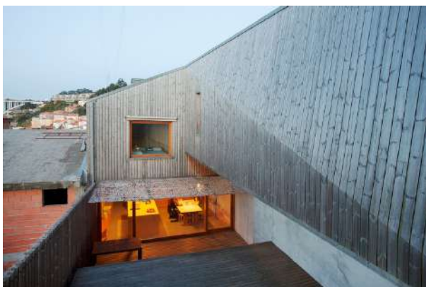
Année de construction 2015, photo 2019, Portugal. La surface a pris une belle teinte gris argenté. La partie du mur dans la zone ombragée a conservé son ton d'origine, tout en ayant légèrement passé.