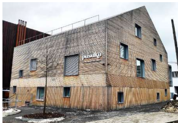
Année de construction 2020, photo 2021, Lituanie. L'orientation des façades peut influencer sur la progression du processus de grisonnement et sur la vitesse de son évolution. La couleur peut parfois devenir partiellement ou complètement noire. Les conditions d'humidité momentanée influent également sur le ton dominant des nuances.