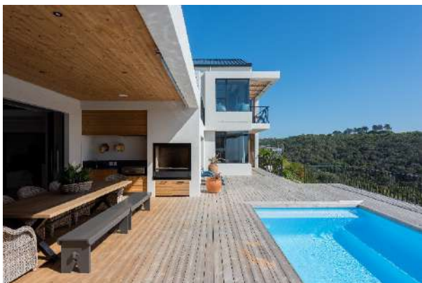
Année de construction, photo 2020, Afrique du Sud. Le processus de grisonnement a commencé. La couleur des planches les plus exposées aux rayons UV commence à s'estomper, avec parfois quelques différences entre elles. Cela est dû aux propriétés inhérentes au bois et à leur variation.