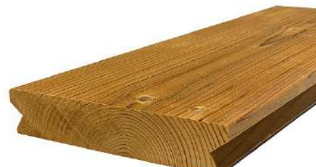
Figure 2: Coté aubier en face visible